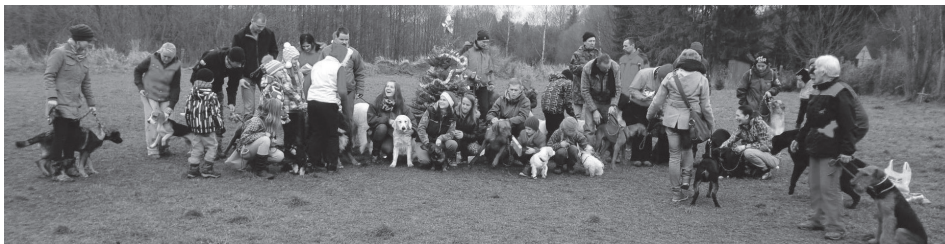
Vánoce pro psy