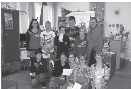
Děti v knihovně při povídání o čertech.

bo přinést k nám do Knihovny Viléma Martínka nebo napište na knihovna@strmilovsko.cz