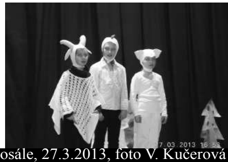
Školní akademie v kinosále, 27.3.2013