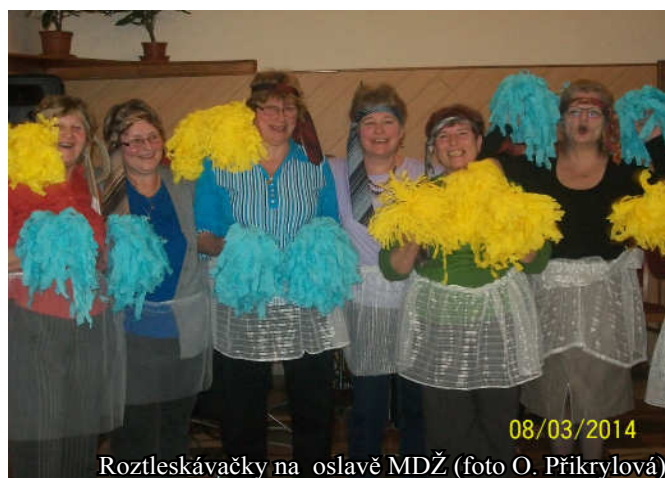
08/03/2014 Roztleskávačky na oslavě MDŽ

ních hodin a pak už nastalo loučení a náš slib střížovickým kolegyním: „Příště u vás!!!“