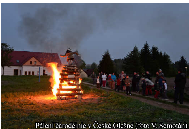
Pálení čarodějnic v České Olešné