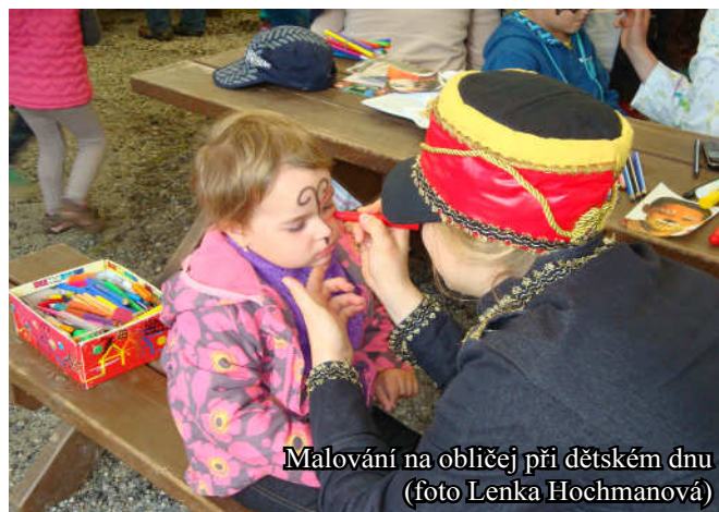
Malování na obličej při dětském dnu