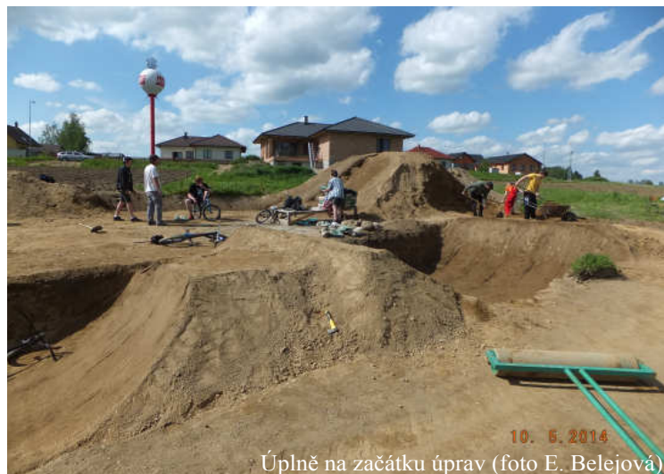
Úplně na začátku úprav