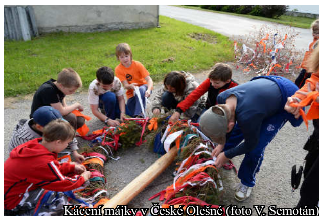
Kácení májky v České Olešné