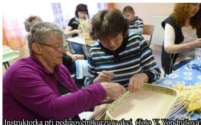
Instruktorka při pedigovém kurzu v akci