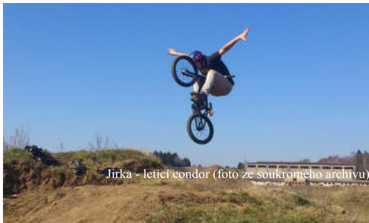
Jirka - letící condor

„Strmilov – pěkné místo k životu“. Je o mistrovské jízdě na kole, o možnosti mít ve Strmilově DIRT PARK pro sebe a další kluky, co je nebaví fotbal či jiné sporty a