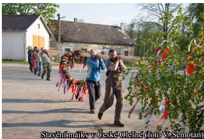
Stavění májky v České Olešné