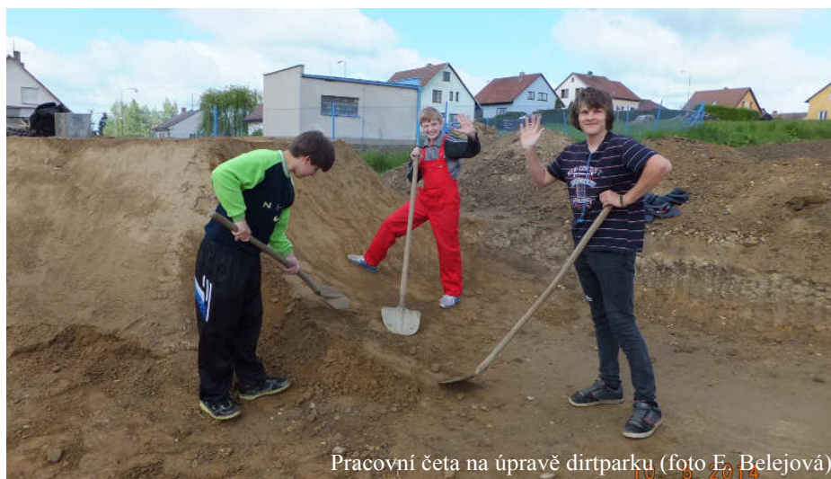
Pracovní četa na úpravě dirtparku

Druhá brigáda se uskutečnila 7.6.2014. V tuto horkou sobotu nám s realizací projektu přišlo pomoci 44 lidí (z toho 15 žen, 10 mužů, 11 dětí, 4 dirtkluci a 4 workoutkluci). Všem moc děkujeme, podmínky byly tentokrát velmi těžké - sucho, horko, půda vyprahlá. Přesto se podařilo: položit dlažbu na další kus cesty (nyní hotovo již 440 m nové procházkové trasy), kultivátorem a ručně zkyprit půdu a vysázet 160ks keřů a rostlin (šeřiky, lísky, růže, jasmíny, ...). Kluci z workoutparku společně s dalšími usadili klády kolem ohniště, natřeli hada pro dětskou část parku. V pondělí 9.6. nastoupila mulčovací jednotka žáků osmé třídy a v poledním horku zabojovala proti uschnutí keřů mulčováním a zaléváním. Každý večer chodí