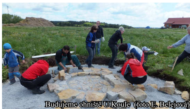
Budujeme ohniště U Koule

Za realizační tým projektu Jaroslava Sedláková, koordinátorka