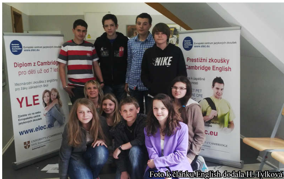
Foto k článku English