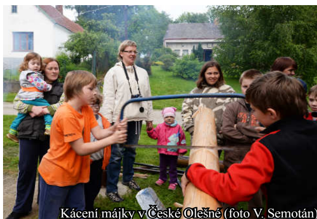
Kácení májky v České Olešné