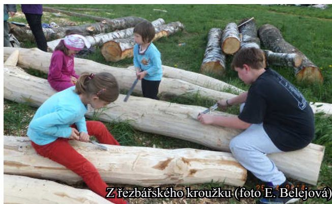
Z řezbářského kroužku