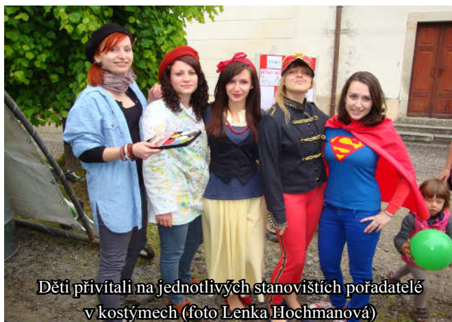
Děti přivítali na jednotlivých stanovištích pořadatelé v kostýmech