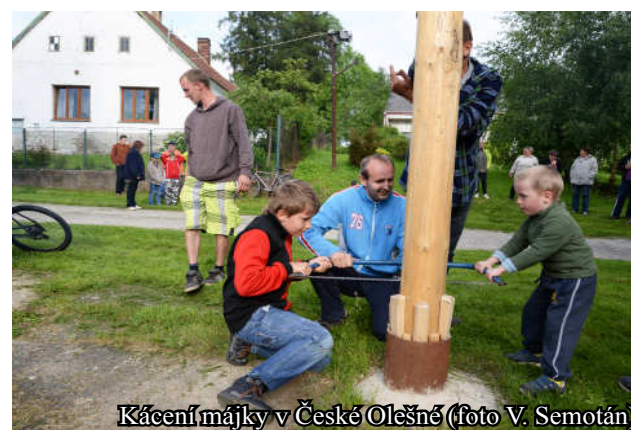
Kácení májky v České Olešné