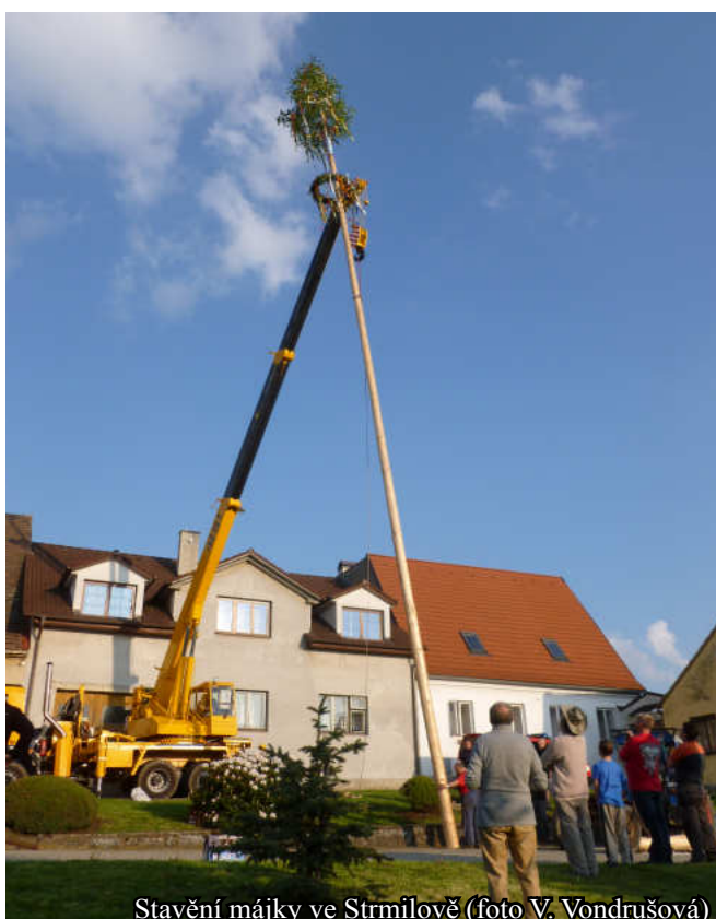
Stavění májky ve Strmilově