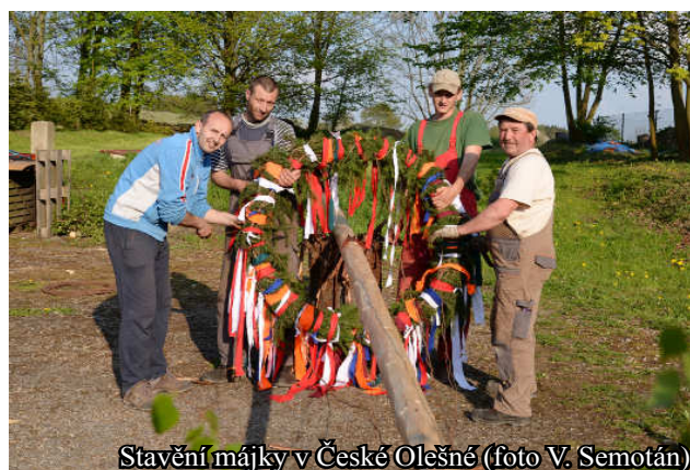
Stavění májky v České Olešné