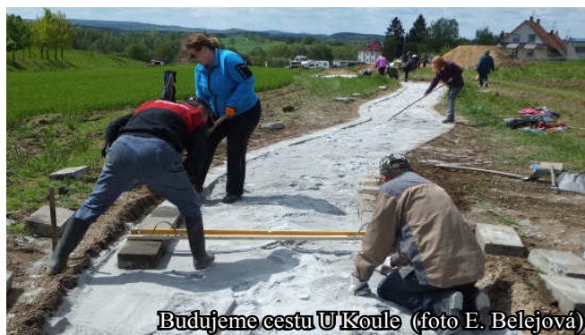
Budujeme cestu U Koule