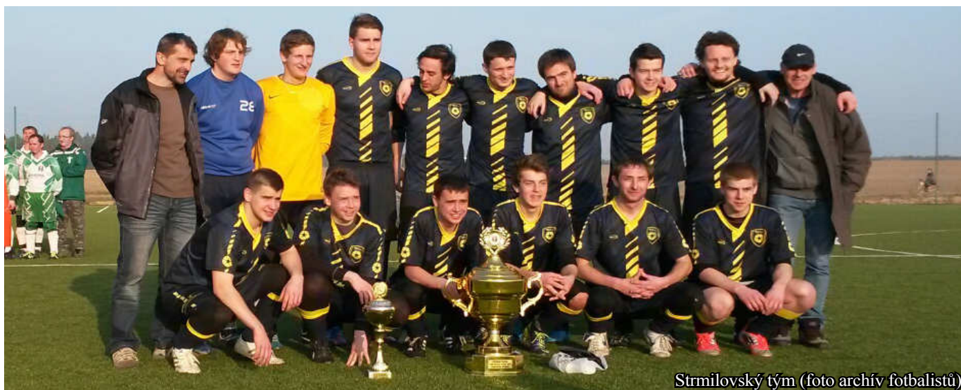
Strmilovský tým