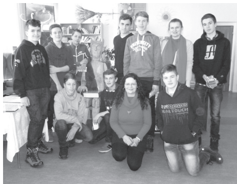
Žáci 9.té třídy s čertem v knihovně