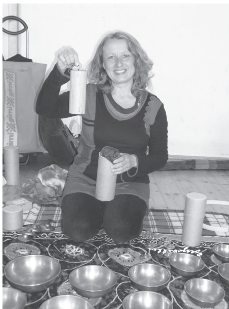
Relaxační večer s tibetskými mísami