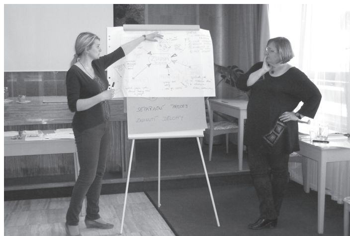
Seminář Rodinné vztahy